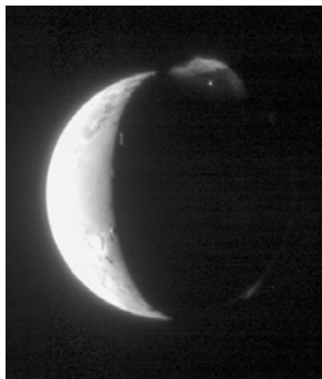
Fot. 2. Wybuchy trzech wulkanów na Io. Zdjęcie wykonane przez sondę New Horizons 1.03.2007r. z odległości 2,3 mln km od księżyca

Erupcja wulkanu Tvashtar jest widoczna na górze zdjęcia. Wyrzucony materiał wznosi się na wysokość 330 km i jest oświetlany przez Słońce oraz światło odbite od Jowisza. Na powyższym zdjęciu można zaobserwować wybuch wulkanu Masubi w prawym dolnym rogu fotografii.