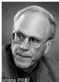
David J. Gross

Nagrodę Nobla z dziedziny fizyki w roku 2004 otrzymali trzej fizycy amerykańscy: David J. Gross, H. David Politzer i Frank Wilczek , „za odkrycie asymptotycznej swobody w teorii silnych oddziaływań”. Dla niefachowców to uzasadnienie brzmi zapewne bardzo dziwnie: jak można „odkryć” coś w teorii, która jest przecież dziełem fizyków, a nie zjawiskiem naturalnym? Okazuje się jednak, że konstrukcje matematyczne budowane przez fizyków teoretyków bywają tak złożone, że pewne ich własności objawiają się dopiero po żmudnych badaniach – i to często nie tym, którzy byli autorami pomysłu leżącego u podstaw konstrukcji. Tak właśnie było tym razem.