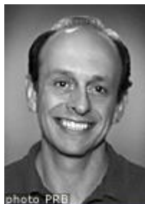
H. David Politzer