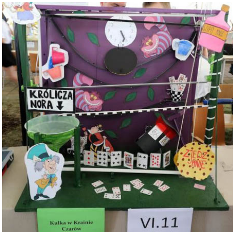
Kulka w Krainie Czarów