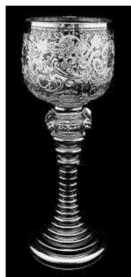
A to nie jest kryształ